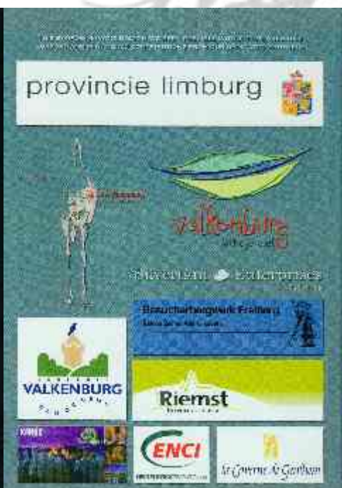
Die Sponsoren der Tagung 2008 auf der Umschlagseite des Tagungsbandes